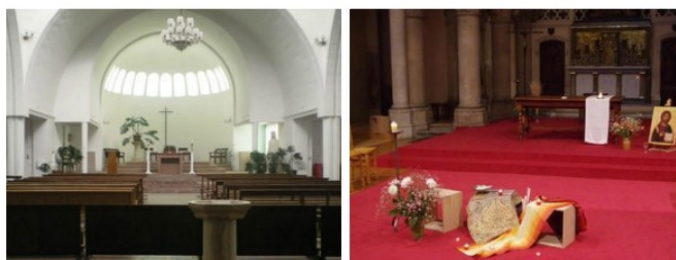
Oran, chapelle Santa-Cruz / Paris, Notre-Dame-des-Anges