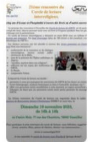
21e Cercle Lecture